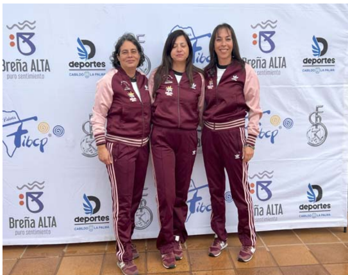
C. D. XXFAREMI FED. INS. La Palma