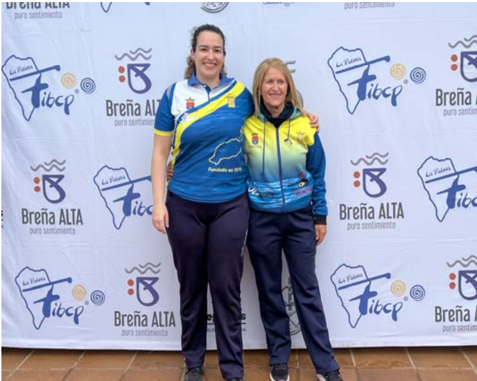
C.D.B. LANZAROTE TROPICAL FED. INS. Lanzarote