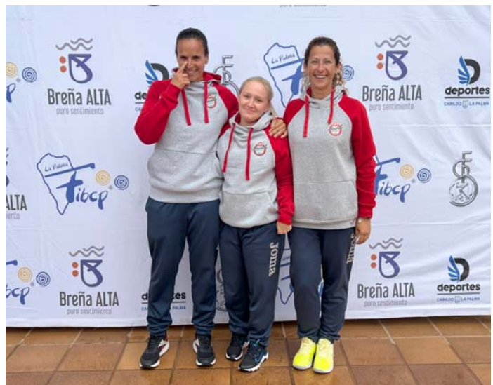
C.D.B.P. GEROD 18 FED. INS. Gran Canaria