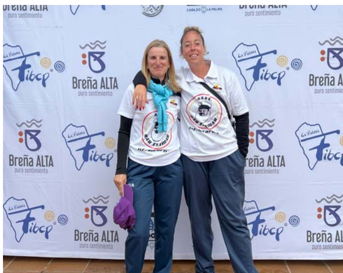
C.D.P. EL PUERTILLO "B" FED. INS. Gran Canaria