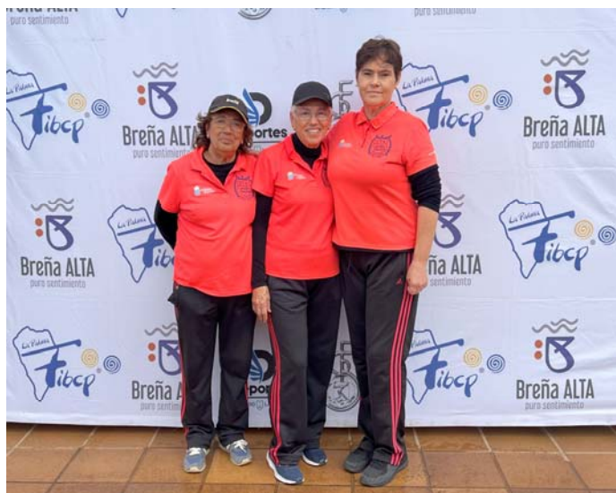
C.D.B.P. CONS. HERNANDEZ FED. INS. La Palma