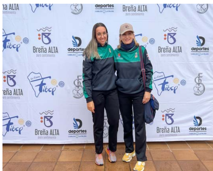
C.D. TIMANFAYA "A" FED. INS. Lanzarote