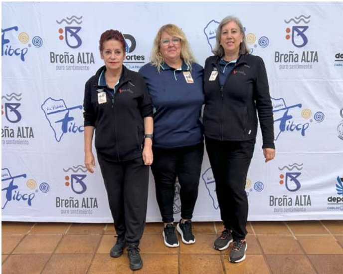
C.D. B.P. LAS ROSAS FED. INS. Tenerife