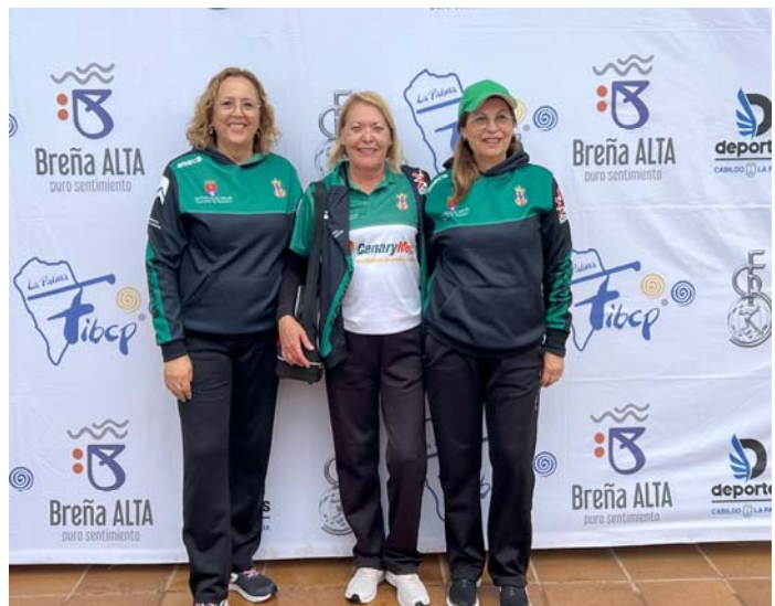
C.D. TIMANFAYA "B" FED. INS. Lanzarote