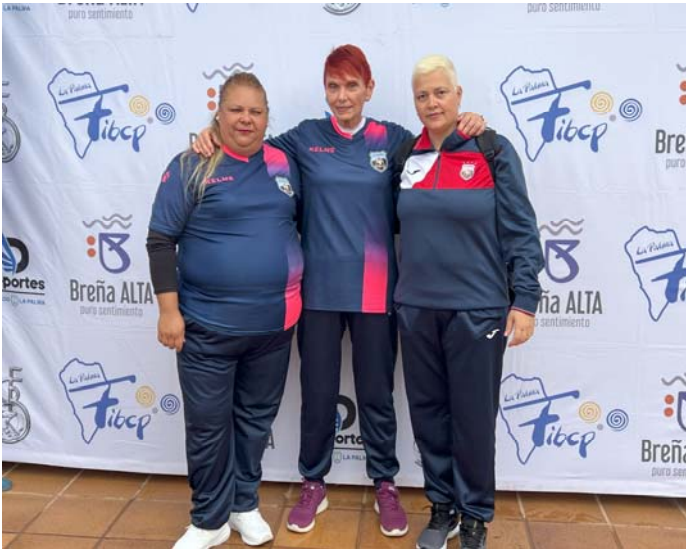
C.D. U.D. SOCORRO FED. INS. Tenerife