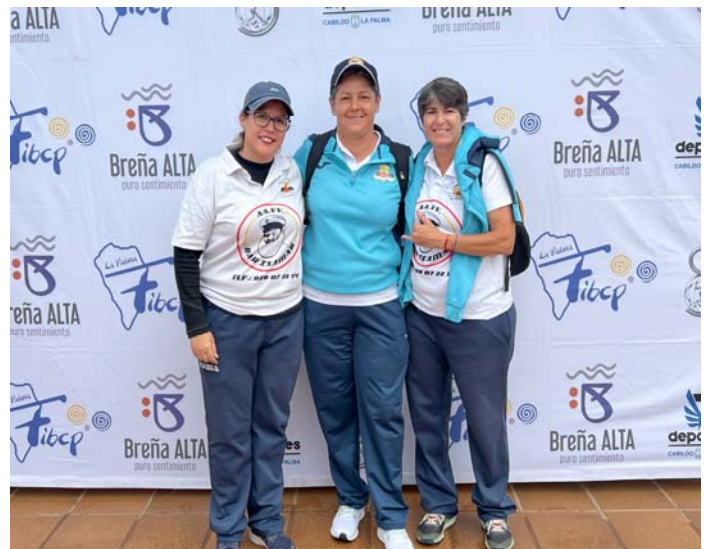
C.D.P. EL PUERTILLO "A" FED. INS. Gran Canaria