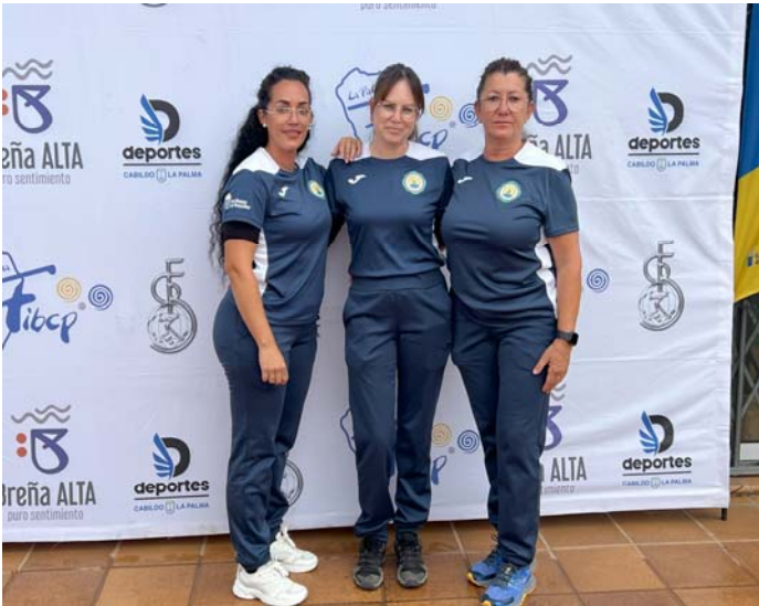
C. D. EL PUNTON FED. INS. La Palma